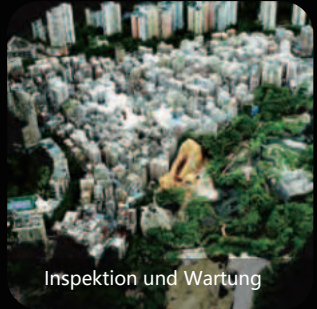
Inspektion und Wartung