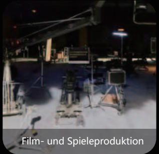
Film- und Spieleproduktion