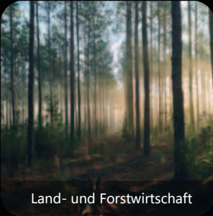
Land- und Forstwirtschaft